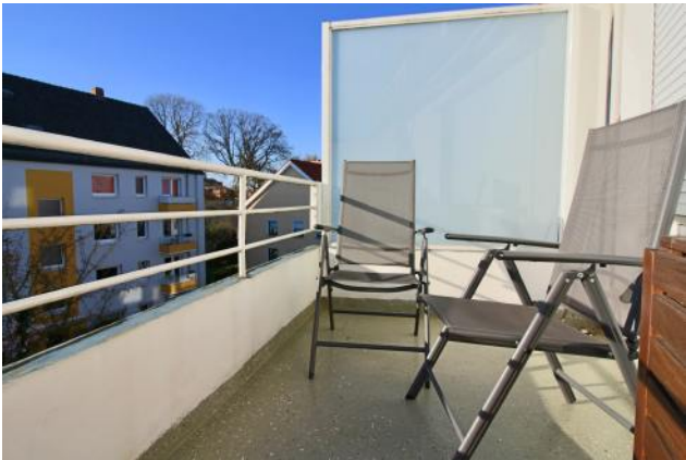
Balkon mit südlicher Ausrichtung