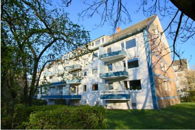
Blick vom Garten auf die Balkone