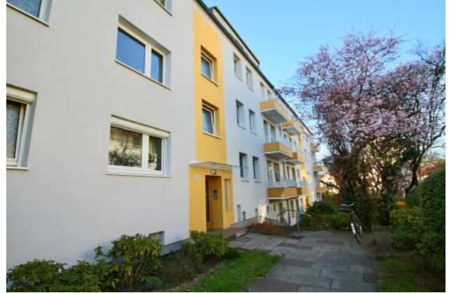
Blick auf den Hauseingang