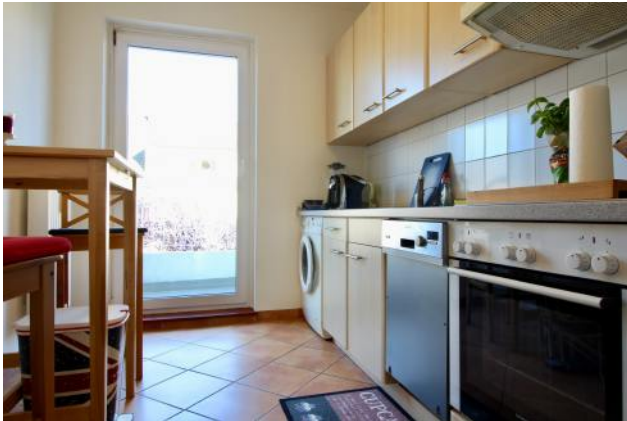
Küche mit Balkon